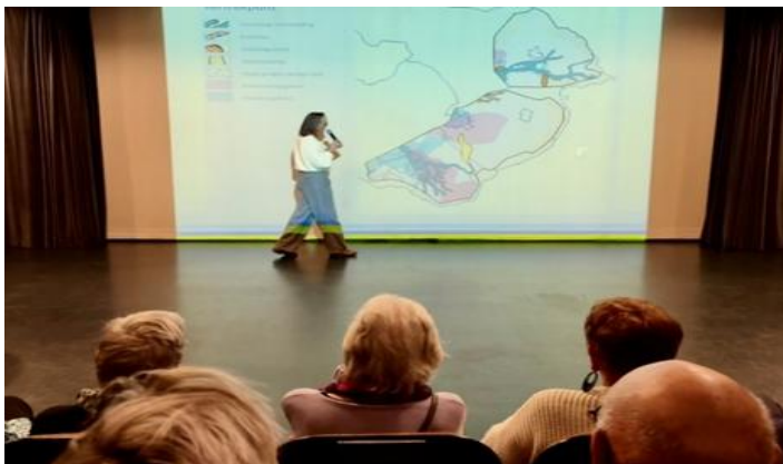
Stroomruggen en rivierlopen in de bodem van de polders

eind 19 e /begin 20 e eeuw (na eerdere plannen voor grootschalige landsbescherming door inpoldering en dijkaanleg) uiterst